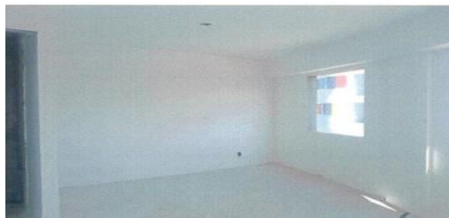
Execução de Gesso Liso - condomínio 5 – Fotos: mar./2023