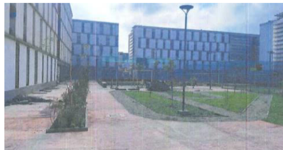
Bloco C – Foto: mar./23.