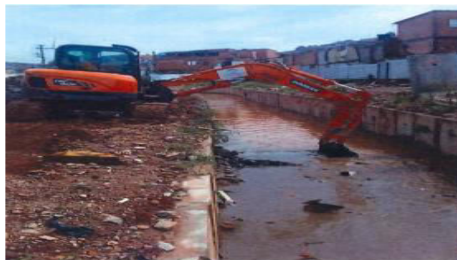
Retirada de Material Aduelas - Guaicuri - Foto: fev./23..