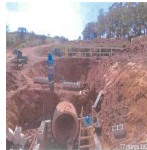
Vila do Sol - Foto: mar./23