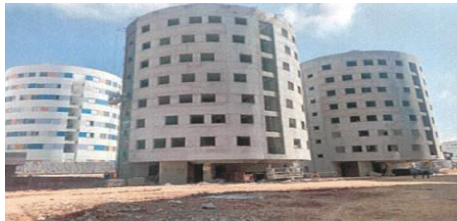
Execução de Revestimento de Fachada- Condomínio 5 – Fotos: mar./23