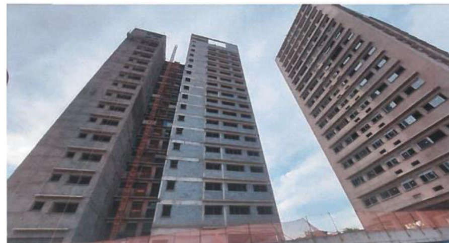
Torres A –Revestimento da Fachada – Fotos: mar./23.