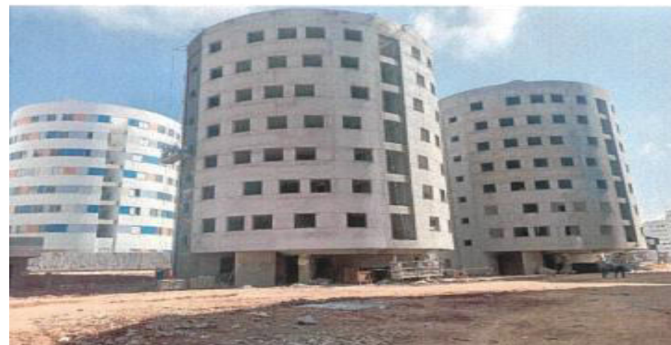
Execução de Revestimento de Fachada- Condomínio 5 – Fotos: mar./23