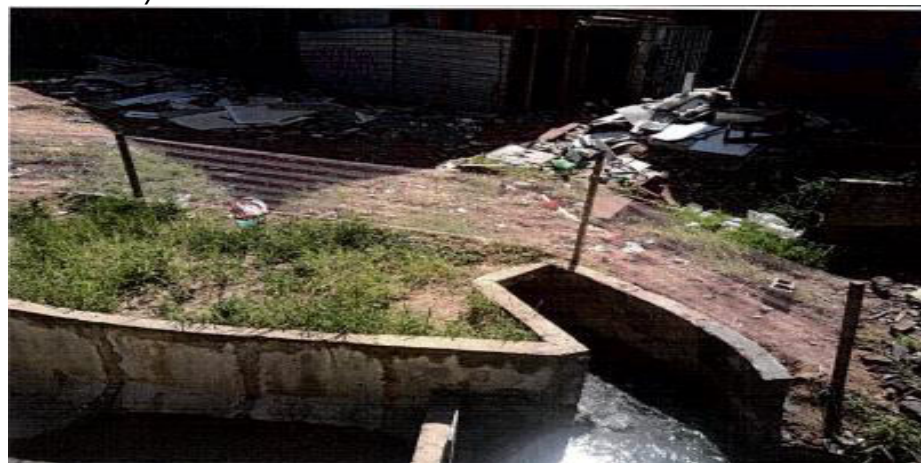
Execução na Sinalização nas Margens do Córrego - Fotos: mar./23.