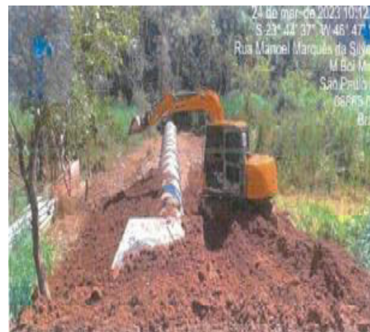
Chácara Sonho Azul - Foto: mar./23.