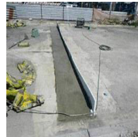
Fornecimento de Colocação de Junta de Dilatação Foto: dez./22.