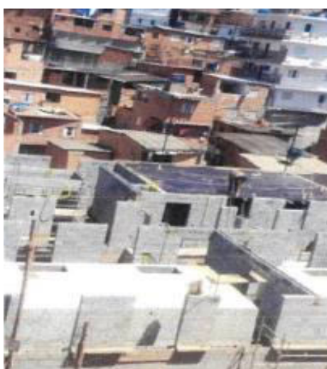
Alvenaria 1º Pavto. - Fotos: mar./23