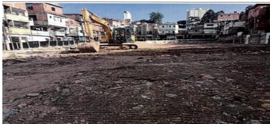
Realização da Regularização do Trecho após as Demolições Manuais - Fotos: mar./23