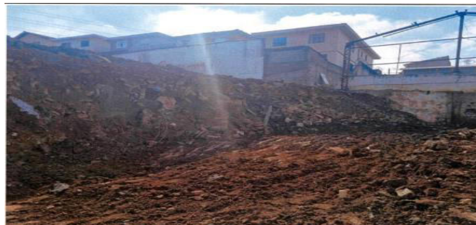
Condomínio Remoção de Entulho - Foto: fev./23.