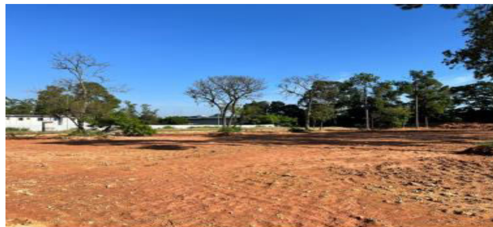
Compactação do Terreno - Área das Torres 4 – Fotos: fev./23.