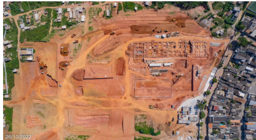
João Cabanas - Foto: mar./22.