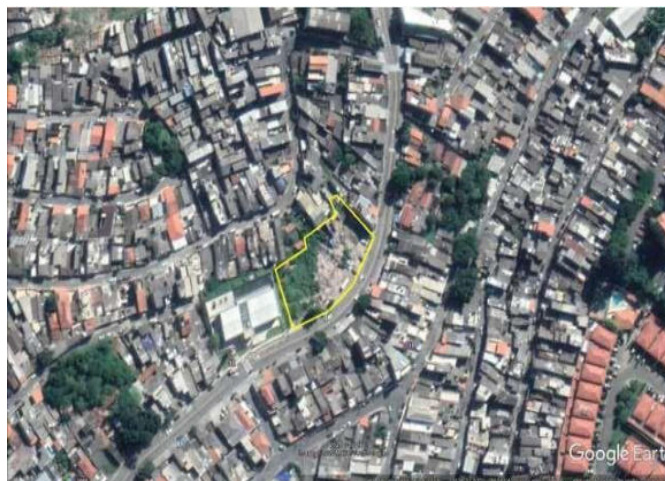
Parque Ipê Dona Deda