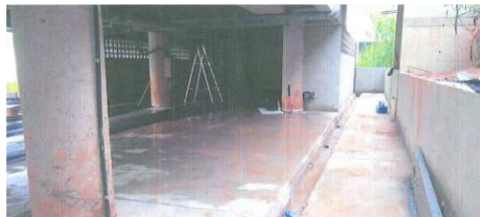
Bloco E – Foto: mar./23.