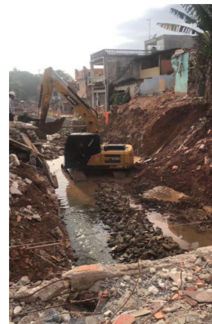
Jardim Ângela - Foto: maio/2023.