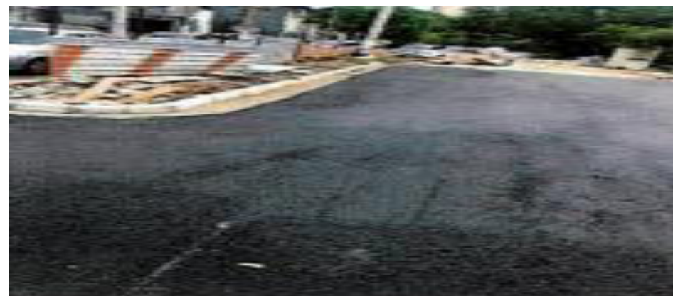
Pavimento concluído – Fotos: mar./23.