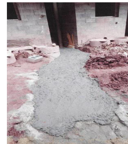
Condomínio D - (Envelopamento de gás) - Foto: fev./23.