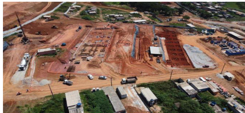
João Cabanas - Foto: mar./22.