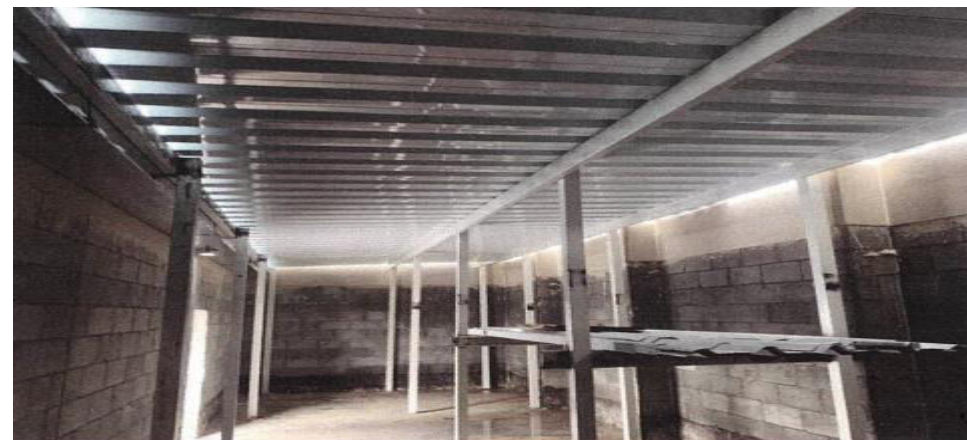
Condomínio D- (Cobertura metálica, calhas e rufos) - Foto: fev./23