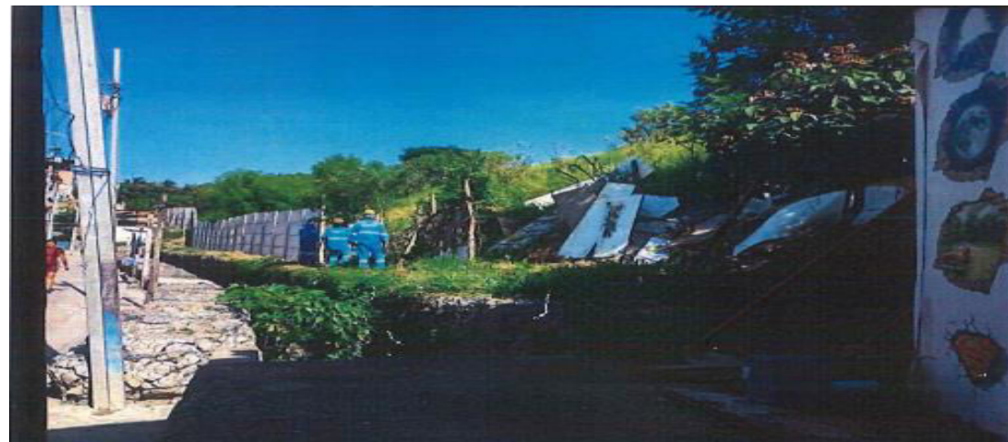
Anthero Gomes - Foto: mar./23.