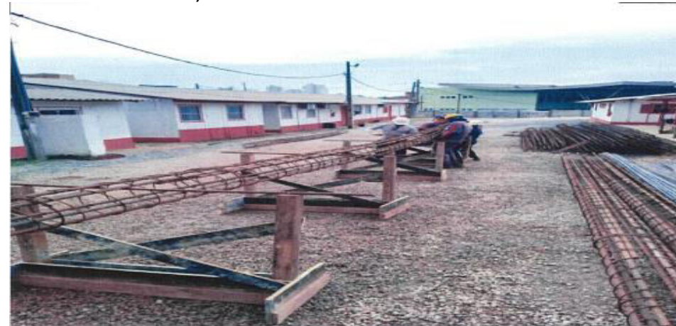
Fase 4 - Armação das Estacas- Fotos: mar./23.