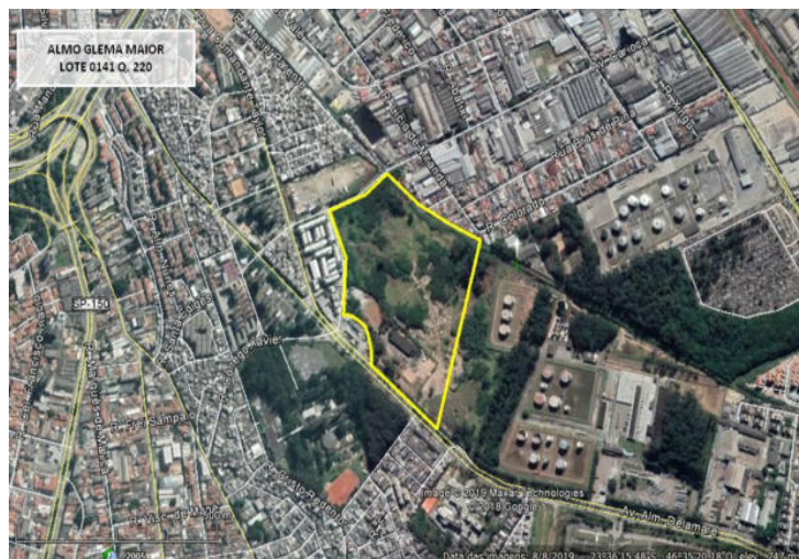
Almo – Área Maior