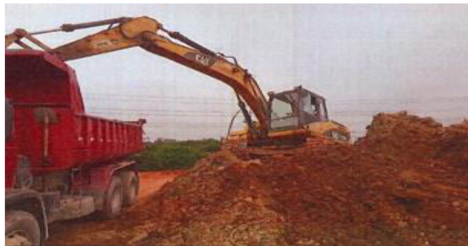
João Cabanas - Remoção de Material para o Bota fora - Fotos: mar./23.