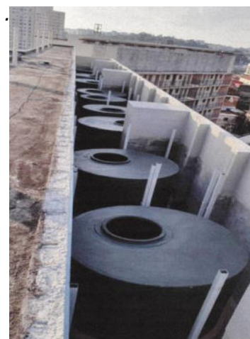
Condomínio D (reservatórios superiores)- Foto: fev./23.