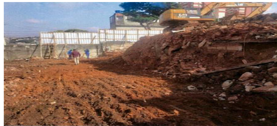
Condomínio Remoção de Entulho - Foto: fev./23.