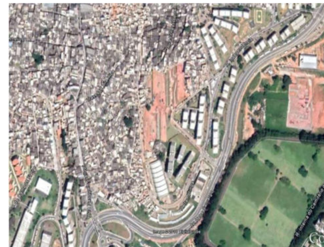
Paraisópolis – Parque Sanfona