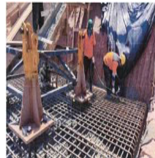
Bloco de Fundação Grua -Fotos: mar./23.