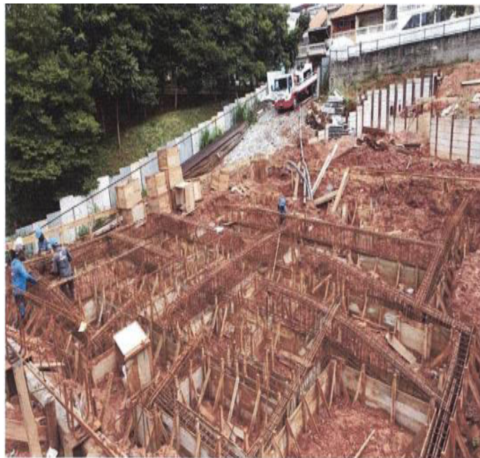
Armação de Vigas Baldrame – Fotos: fev./23.