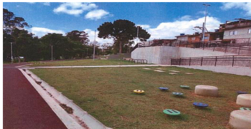
Cantinho do Céu - Foto: jan./23