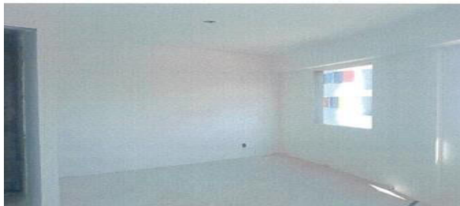
Execução de Gesso Liso - condomínio 5 – Fotos: mar./2023