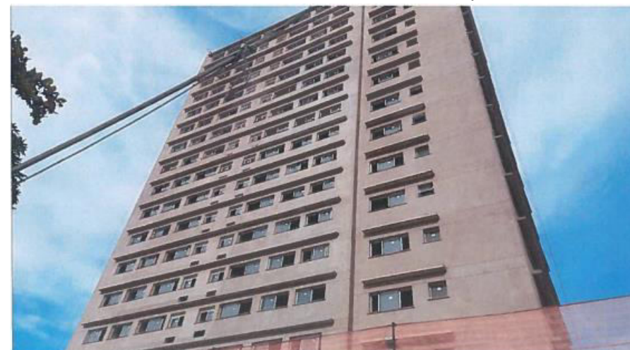
Torre B Caixilho de Alumínio e Vidro - Foto: mar./23.