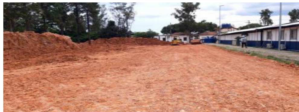
Aterro Compactado - Fotos: fev./23.