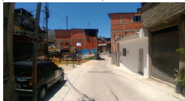
Jardim Arnaldo - Foto: out./2022.