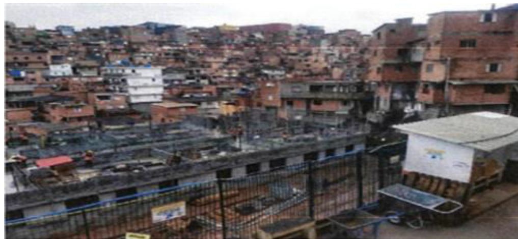
Alvenaria 1º Pavimento. – Fotos: mar./23.