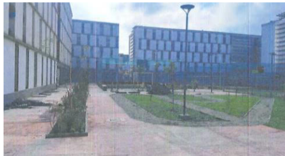
Bloco C – Fotos: mar./23.