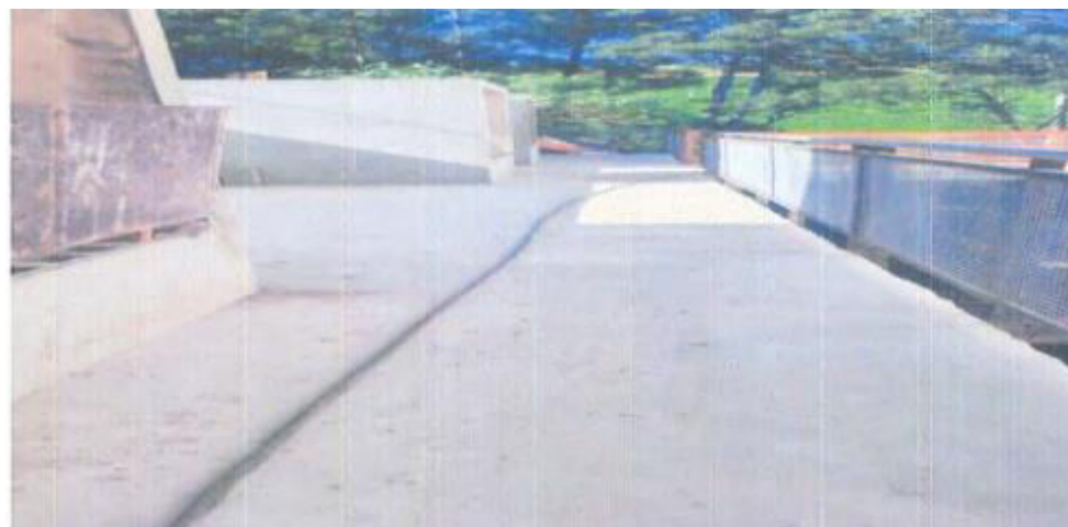
Bloco E – Contra Piso Passarela - Fotos: mar./23.