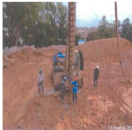
Vila do Sol - Foto: mar./23.