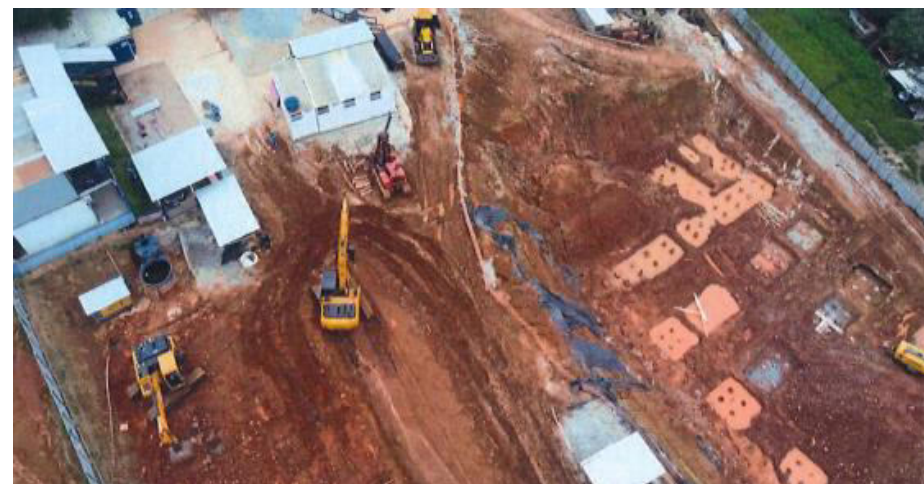
João Cabanas - Foto: fev./23.