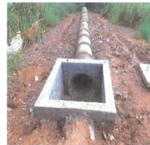
Chácara Sonho Azul - Foto: mar./23