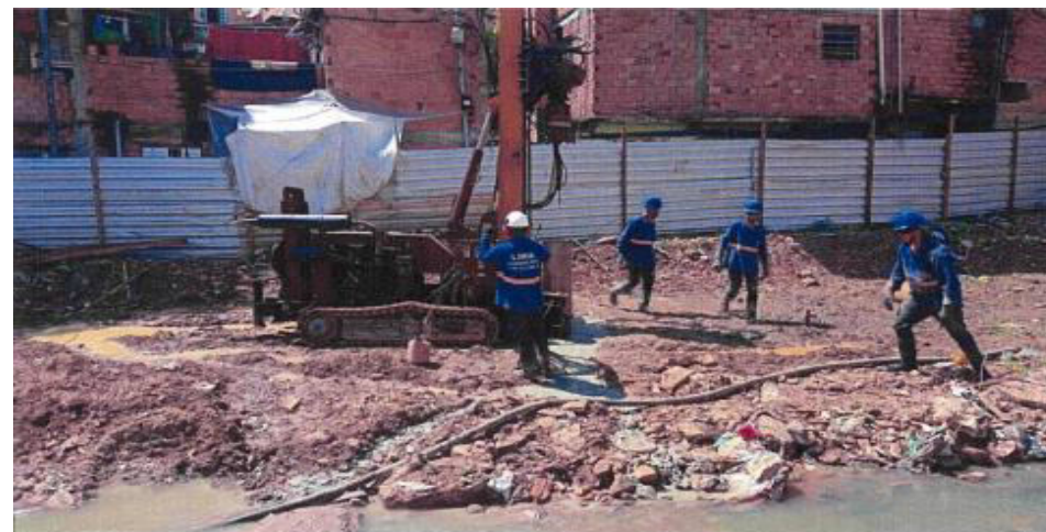
Fase 4 - Execução de Estaca Tipo Raiz, 400mm, com Perfuração em Solo – 130T - - Fotos: mar./23