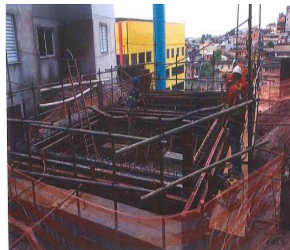
Alto da Alegria - Foto: mar./23.