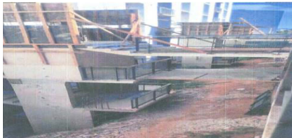
Bloco E – Guarda Corpo Passarela - Fotos: mar./23.