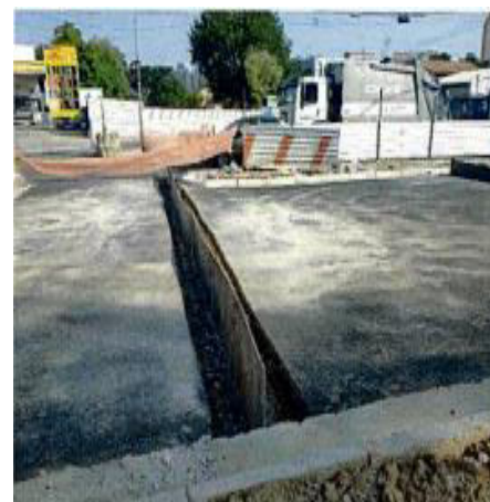
Limpeza de Junta de Dilatação Fotos: mar./23.