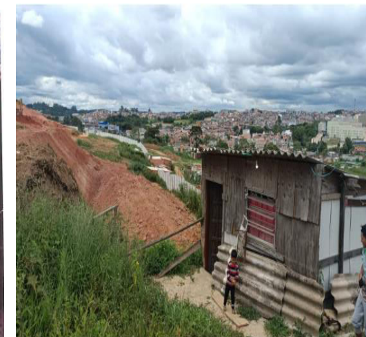
João Cabanas – Foto: mar./23