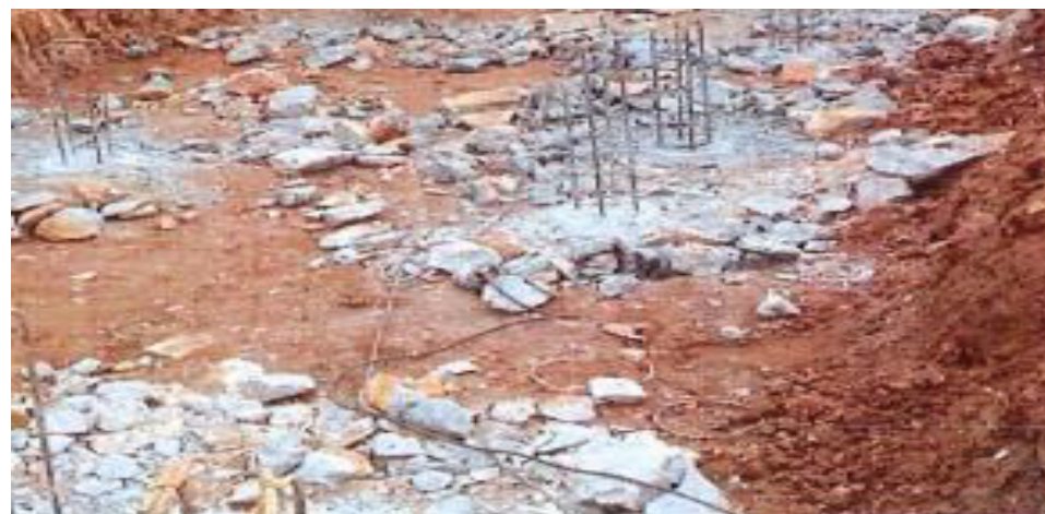
João Cabanas - Execução de Estacas - Fotos: mar./23.