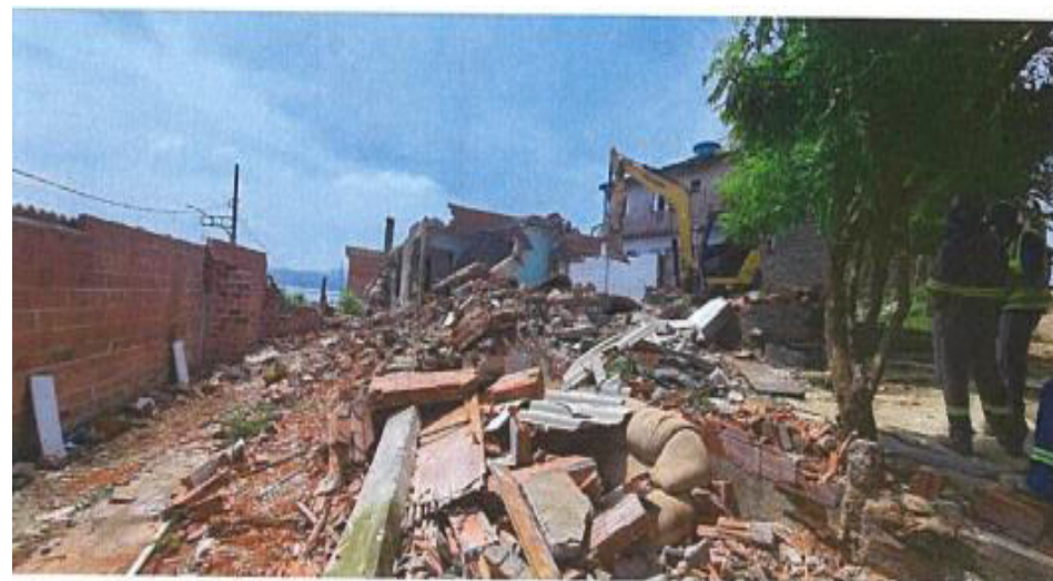
Monte Verde - Foto: jan./23