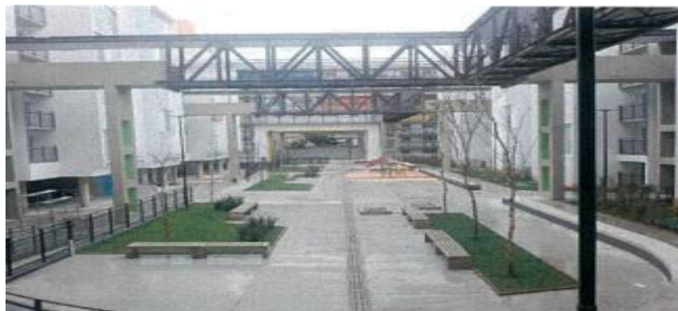
Execução de Steel Deck – Fotos: mar./23.